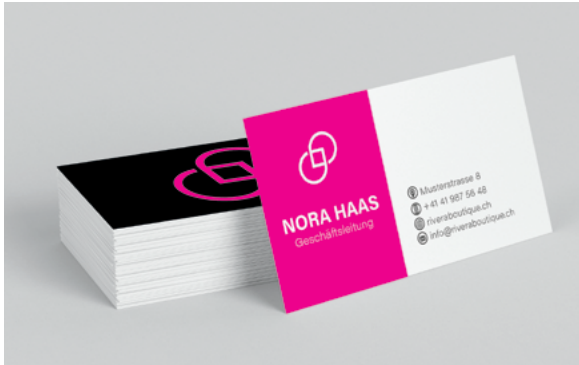
NEON- UND METALLIC-DRUCK