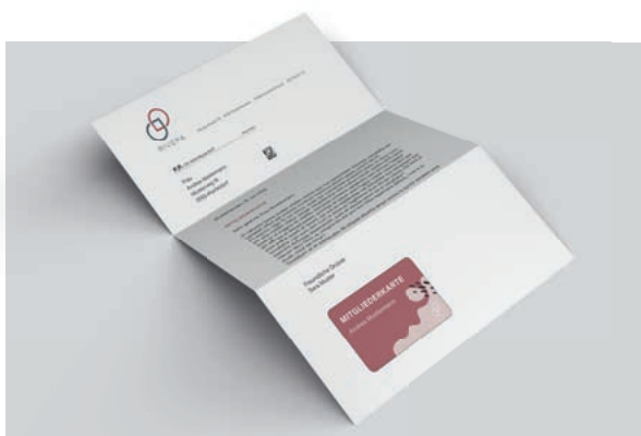
BRIEF MIT COUPON